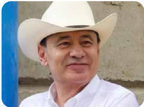
Alfonso Durazo Montaña