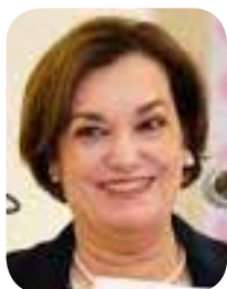
María Dolores del Río

La decisión de María Dolores del Río de solicitar licencia a la Secretaría de Anticorrupción y Buen Gobierno para participar en el proceso interno de Morena confirma que la competencia por la candidatura a la gubernatura de Sonora entra en una fase decisiva. Conforme se acerca la publicación de la convocatoria nacional, los distintos aspirantes comienzan a formalizar su separación de los cargos públicos que actualmente desempeñan, en cumplimiento de los acuerdos establecidos dentro del partido. Este proceso busca generar condiciones de equidad entre quienes aspiran a